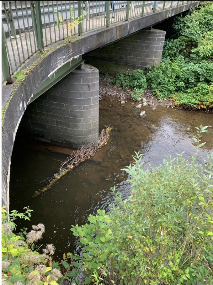
Brücke am Seniorenzentrum St. Josefsheim