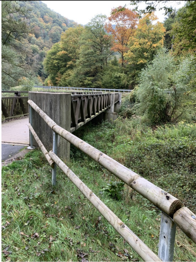
Brücke am Radweg (Baujahr 2021)