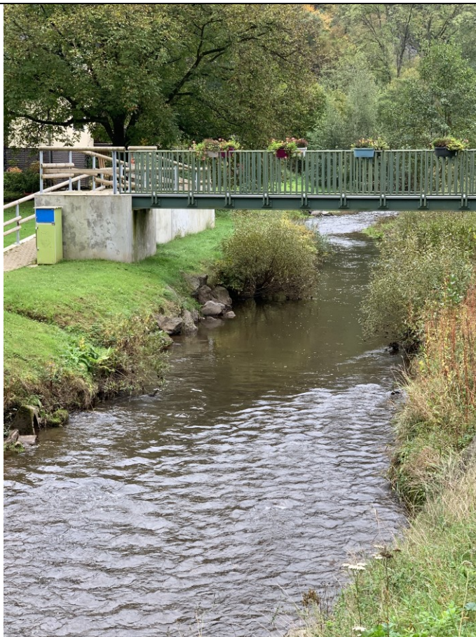
Brücke in Höllenthal (Baujahr 2020)