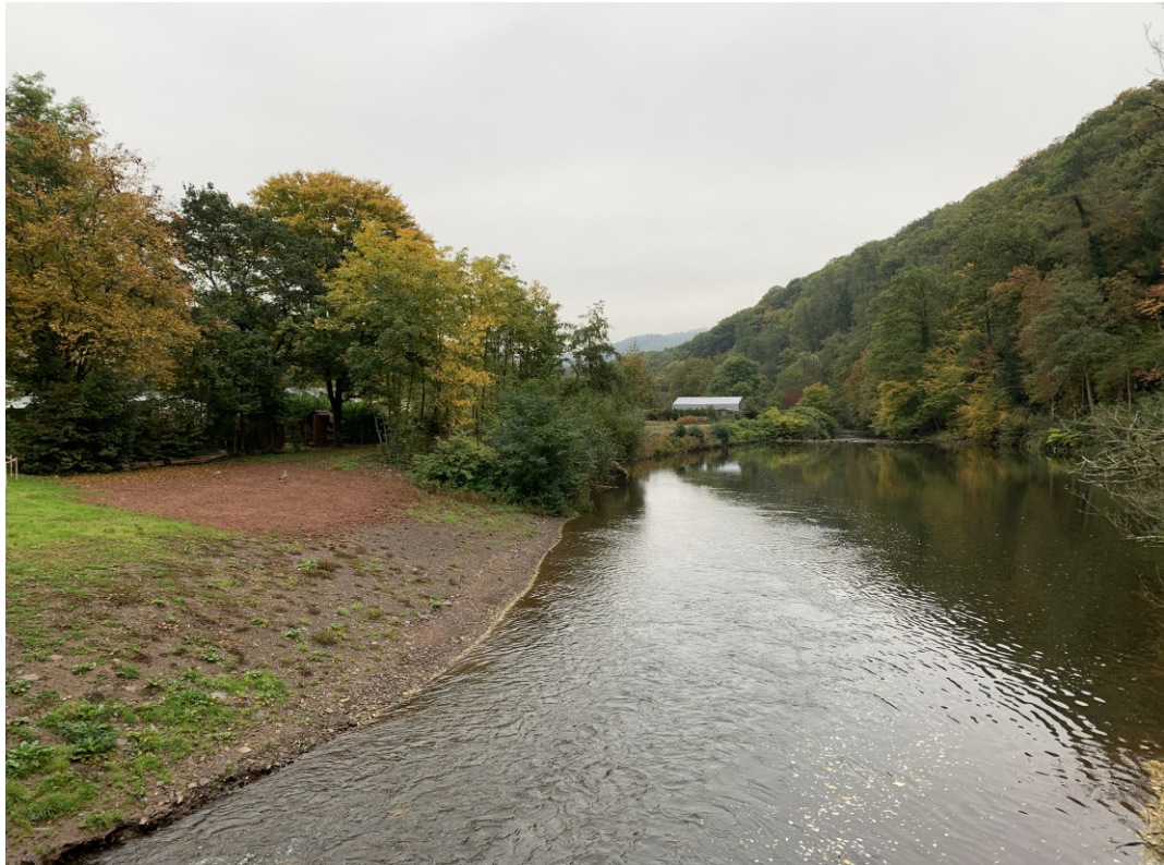
Sicht auf das Geröllfangbecken von der angrenzenden Brücke aus.