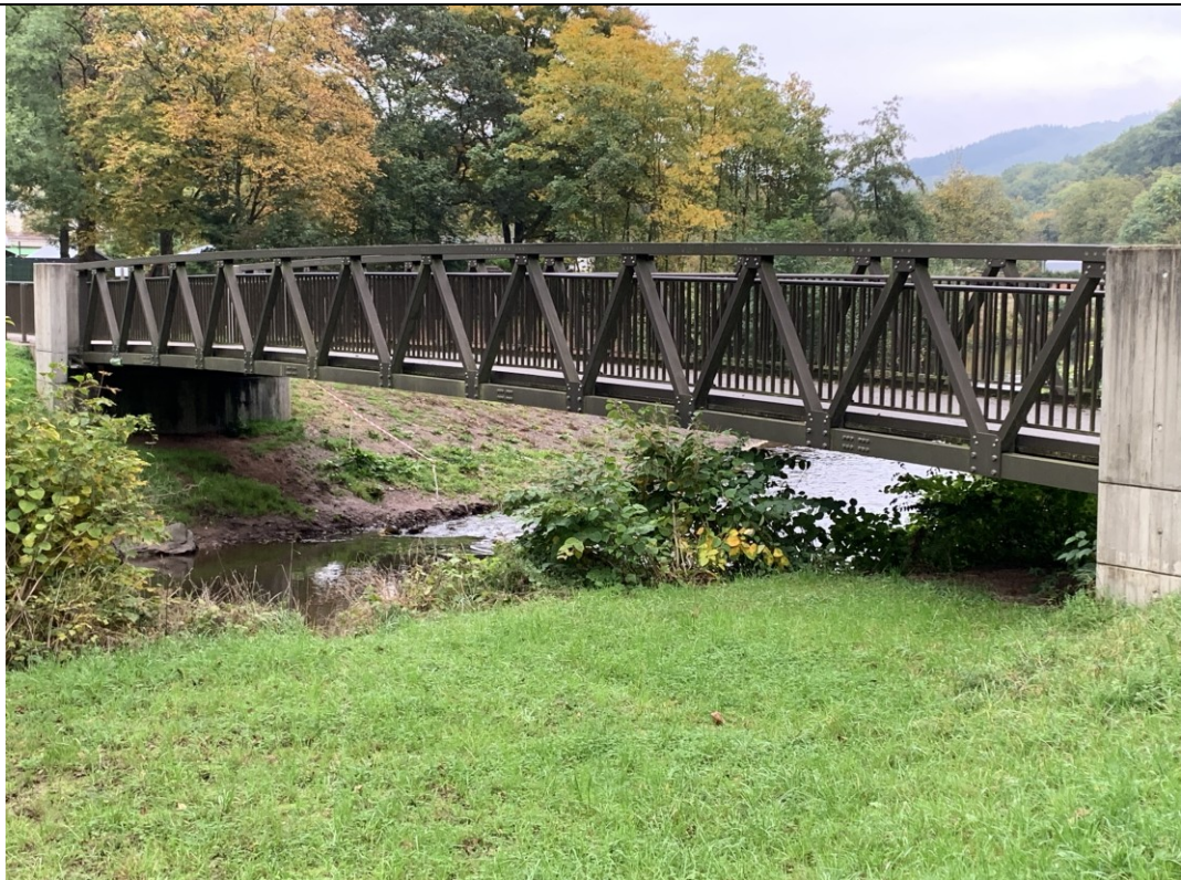
Kein akuter Handlungsbedarf ersichtlich, die Brücke ist frei von Totholz und die Durchlässigkeit gegeben.