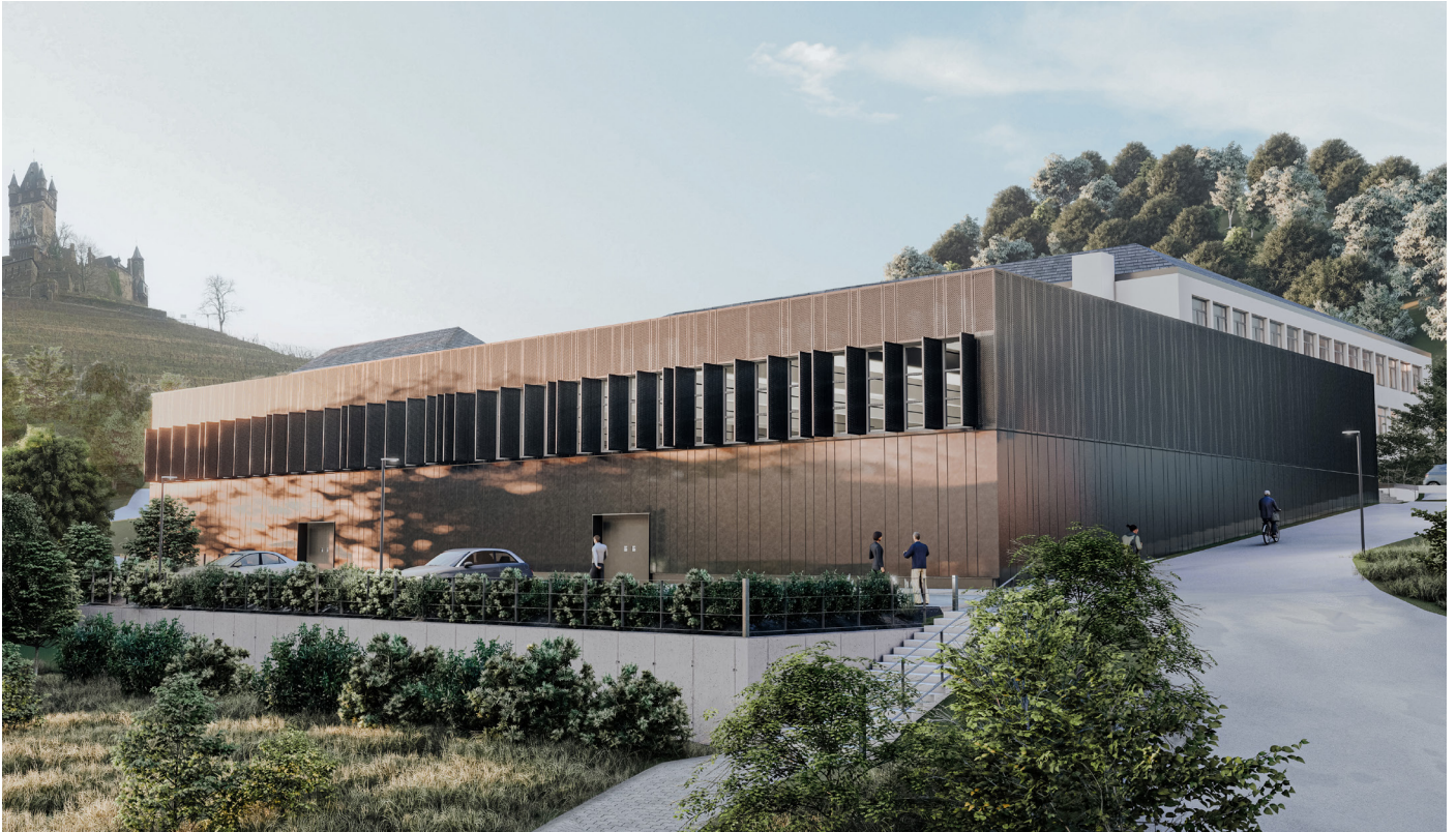
1.3 Visualisierung ganzes Gebäude