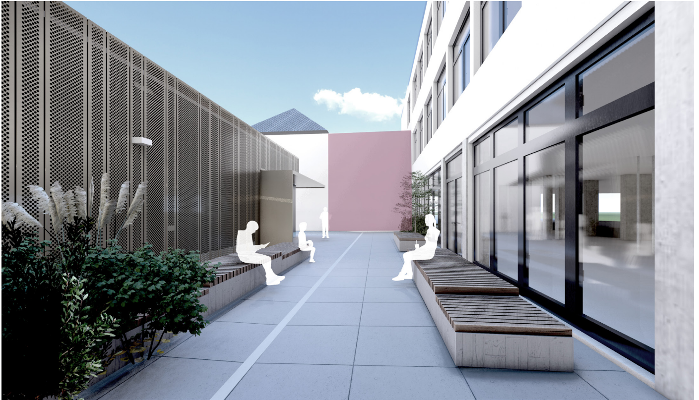
1.5 Visualisierung Innenhof